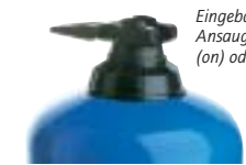
Eingebauter By-Pass-Ansaugsystem eingeschaltet (on) oder ausgeschaltet (off).

Die Optionen ermöglichen es, den Dosatron optimal an den Bedarf anzupassen. Deren Notwendigkeit wird mit der Unterstützung unserer technischen Abteilung festgelegt.