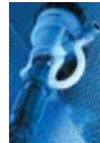
Die Option Außeneinspritzung ermöglicht den Einsatz bestimmter korrosiver Konzentrate.

■ Bei weiteren Fragen senden Sie sich mit uns in Verbindung.