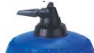
Eingebauter By-Pass: Ansaugsystem eingeschaltet (on) oder ausgeschaltet (off).

Die Optionen ermöglichen es, den Dosatron optimal an den Bedarf anzupassen. Deren Notwendigkeit wird mit der Unterstützung unserer technischen Abteilung festgelegt.